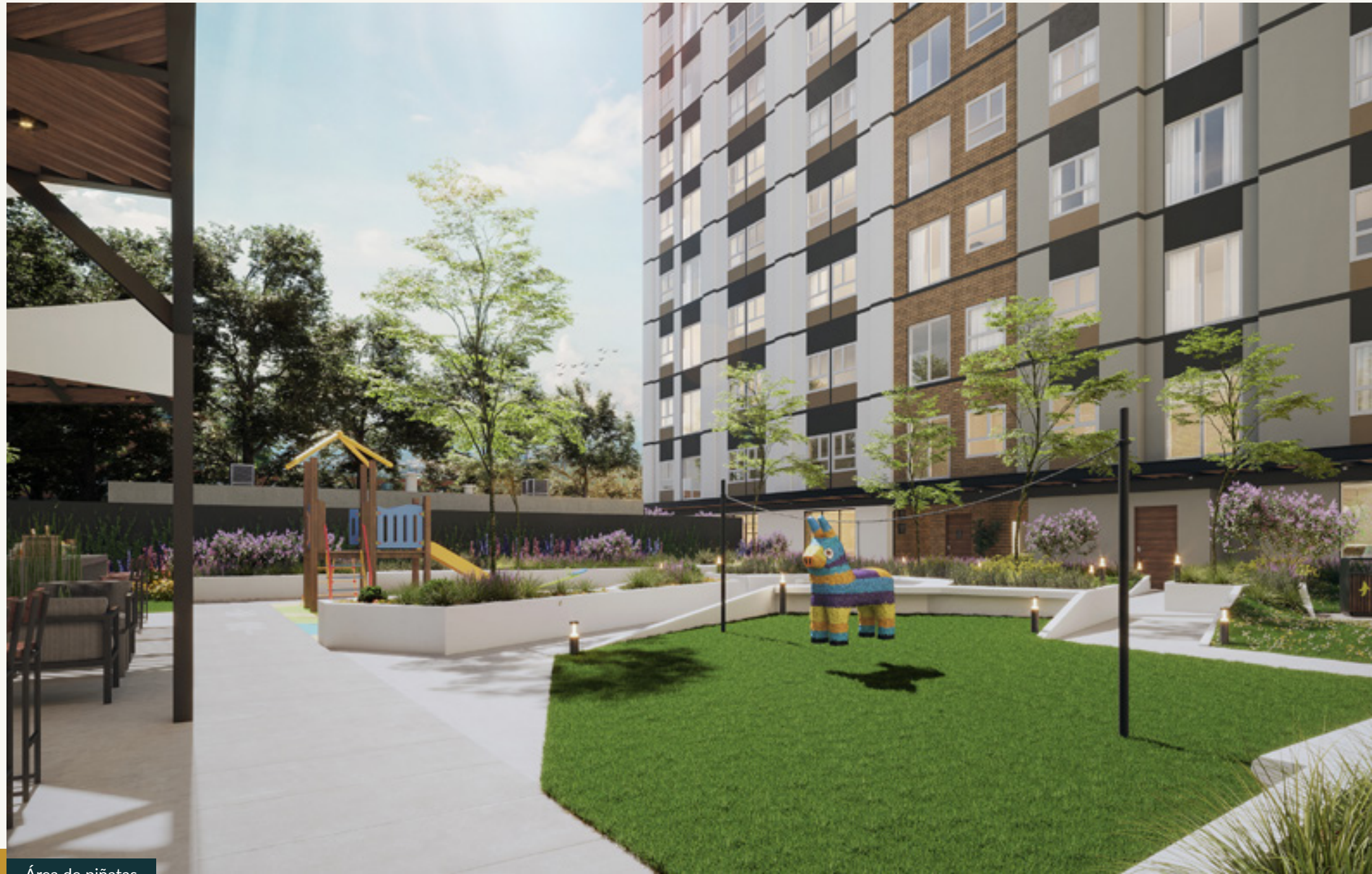
Área de piñatas