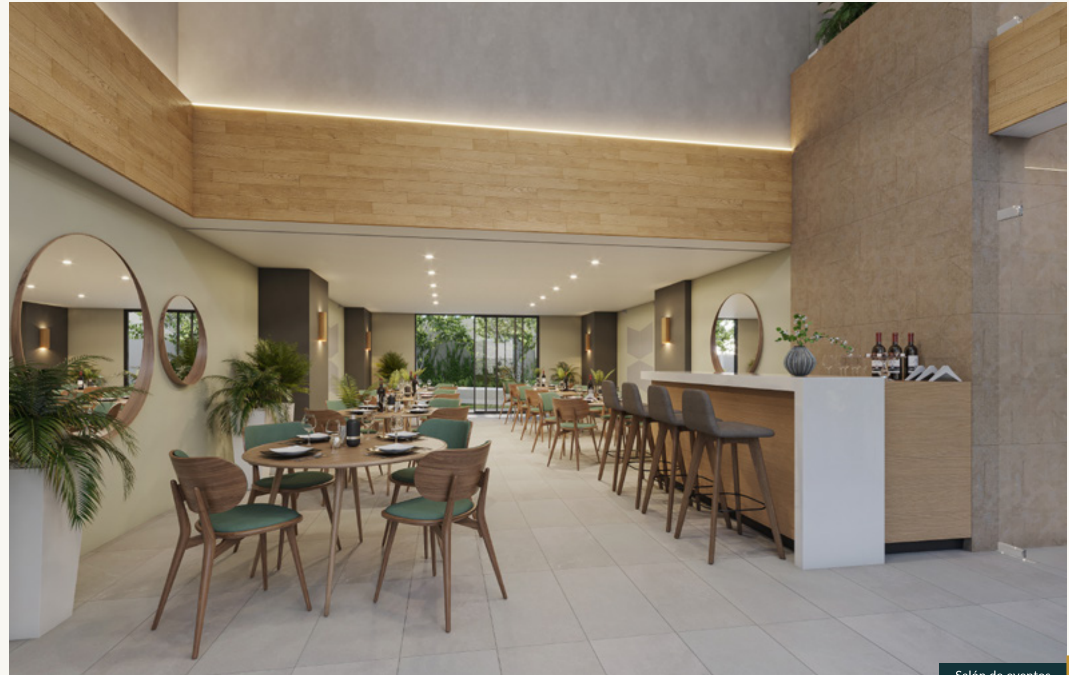
Salón de eventos